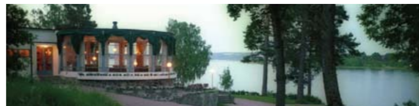
Kveldsstemming, Hvalstrand Bad

NaKuHel-senteret i Asker inviterer til fire opplevelses-turer med buss i nærområdet for kommunens eldre.