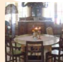
Søndre Tveten, interiør